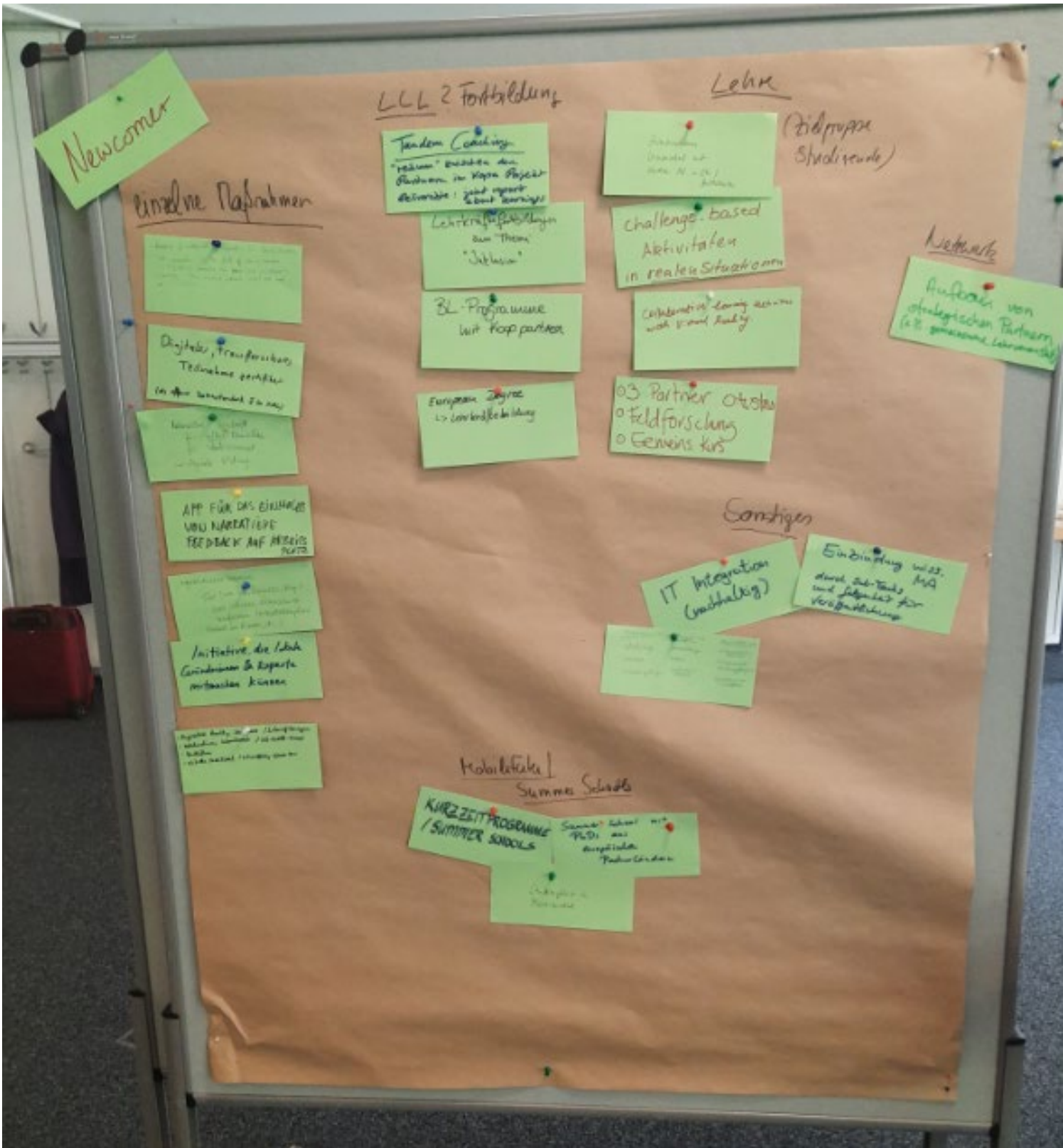
Notizen mit Relevanz insbesondere für „Newcomer“ in Erasmus+ Kooperationsprojekten