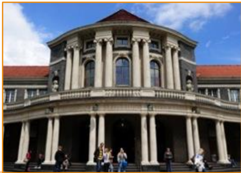
DAAD / Hagenuth