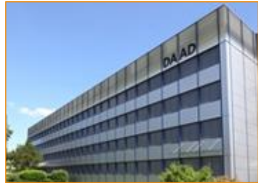
DAAD / Bosse und Meinhard