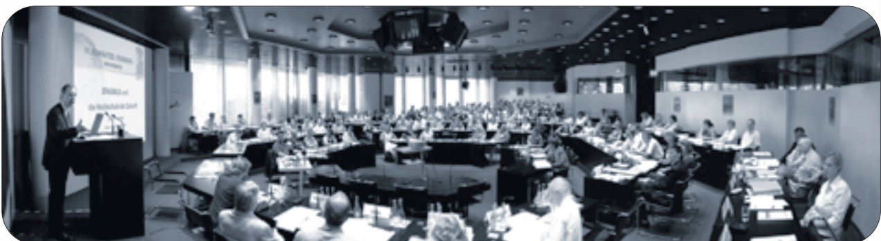
SOKRATES/ERASMUS-Jahrestagung 2006 in Bonn