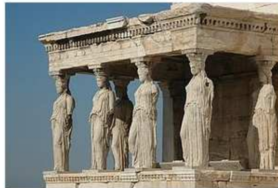
The Karyatides statues of the Erechtheion

Die Geschichte Griechenlands reicht mehr als 4.000 Jahre zurück. Und spätestens seit dem Film "My Big Fat Greek Wedding" ist bekannt, dass sich fast alles auf die griechische Sprache und Geschichte zurückführen lässt.