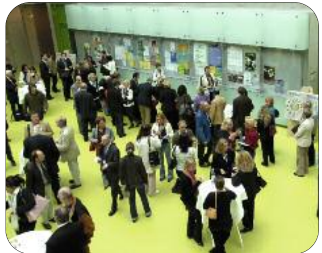
Internationales TEMPUS-Networking an der TU Dresden

Neu ist außerdem, dass mindestens 50% des Gesamtbudgets für Joint Projects und mindestens 25% für Structural Measures verwendet werden. Insgesamt beabsichtigt die EU-Kommission, verstärkt multi-regionale Projekte zu fördern, an denen Institutionen aus mehr als einem TEMPUS-Partnerland beteiligt sind. Es ist daher vorgesehen, dass je Partnerregion 30% der Mittel für multi-country projects vergeben werden.