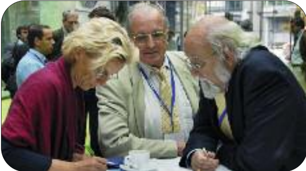
Erfahrungsaustausch zur Vorbereitung von TEMPUS-Anträgen

Es ist also äußerst wichtig, sich bereits in der Vorbereitungsphase für einen Projekttyp zu entscheiden, um die zutreffenden Prioritäten für das jeweilige Partnerland und den jeweiligen Projekttyp rechtzeitig einplanen zu können.