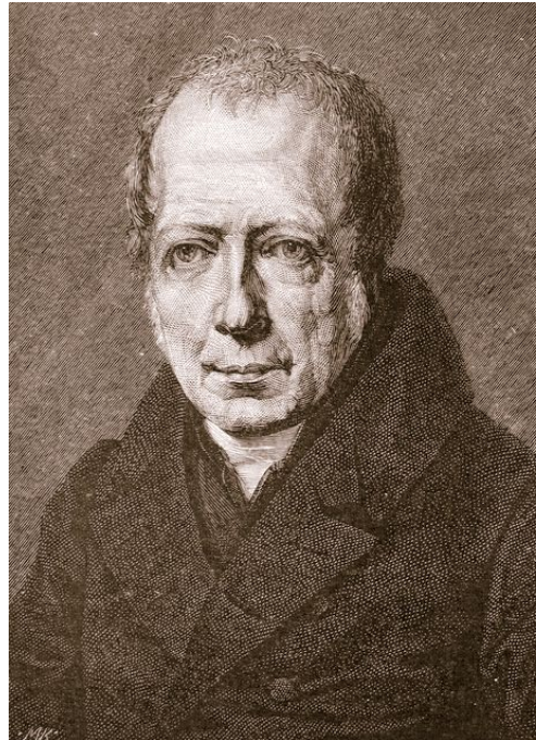
Wilhelm von Humboldt 1809/10