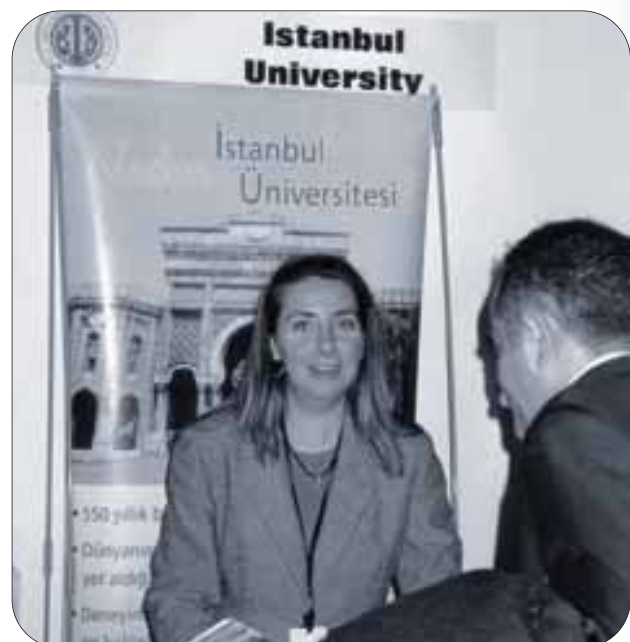
Deutsch-Türkische Informationsmesse in Ankara

Es wurden vier Bachelorstudiengänge und ein Masterstudiengang eingerichtet, mit großzügigen Laboratorien, Lehrbetrieben und einem Materialprüfungsinstitut. Am wichtigsten für den dauerhaften Erfolg war aber ein Förderprogramm für den türkischen Hochschullehrernachwuchs für Textiltechnik. Das Projekt beinhaltete deshalb auch ein Stipendienprogramm für 20 türkische Textilingenieure für einen einjährigen Studien- und Forschungsaufenthalt in Deutschland zur Förderung ihrer wissenschaftlichen Qualifizierung. Heute sind der Großteil der damaligen Stipendiaten in der Tat als türkische Professoren nicht nur an der Ege Universität, sondern auch an anderen türkischen Ausgrün-