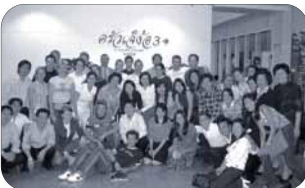
Studenten der RWTH Aachen in Bangkok