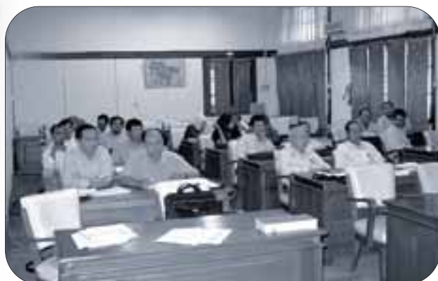
Fortbildungskurs an der Gadjah Mada Universität in Yogyakarta (Indonesien)